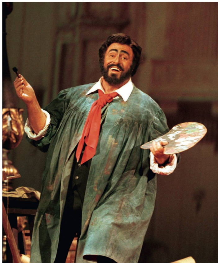
Généreux, le ténor a beaucoup contribué à former la relève.

Avec Guillaume Canet, Juliette Binoche et Vincent Macaigne sous la direction de Olivier Assayas, soit un casting d'un certain poids. Voilà, on a tout dit... ou presque. Cela se passe dans le monde de l'édition et on cause de bouquins, de l'avenir du livre. Sans aucun enthousiasme. Ah oui, tout ce beau monde couche à droite et à gauche, toujours sans aucun plaisir. Bref, si vous voulez vous endormir devant le poste, un film à conseiller. Quel ennui! Doubles vies , 108'