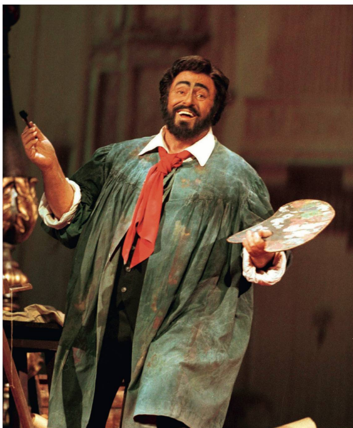
Généreux, le ténor a beaucoup contribué à former la relève.

Avec Guillaume Canet, Juliette Binoche et Vincent Macaigne sous la direction de Olivier Assayas, soit un casting d'un certain poids. Voilà, on a tout dit... ou presque. Cela se passe dans le monde de l'édition et on cause de bouquins, de l'avenir du livre. Sans aucun enthousiasme. Ah oui, tout ce beau monde couche à droite et à gauche, toujours sans aucun plaisir. Bref, si vous voulez vous endormir devant le poste, un film à conseiller. Quel ennui! Doubles vies , 108'