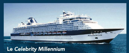
Le Celebrity Millennium

Le pré et post acheminement de votre résidence à Genève | Les excursions | Les boissons aux repas et en dehors | Les dépenses personnelles à bord et/ou pendant les excursions | Les assurances annulation/bagages/rapatriement.