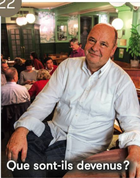
Que sont-ils devenus?