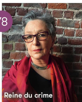
Reine du crime