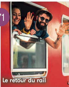
Le retour du rail