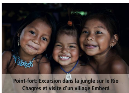
Point-fort: Excursion dans la jungle sur le Rio Chagres et visite d'un village Emberá

Avec le Royal Clipper, vous ressentirez l'émotion de la navigation à la voile, mais la comparaison s'arrête là: à bord, vous retrouverez tous le luxe et le confort moderne, le tout ans un navire de taille humaine qui vous plongera véritablement dans cette ambiance tant appréciée d'un yacht privé. Barbecue sur une plage déserte, observation des dauphins qui jouent dans le sillage du navire au crépuscule, sieste dans le filet de proue en dessus de l'eau... Ici, tout est différent, convivial, raffiné.