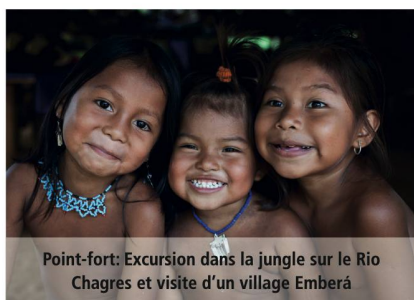
Point-fort: Excursion dans la jungle sur le Rio Chagres et visite d'un village Emberá

Avec le Royal Clipper, vous ressentirez l'émotion de la navigation à la voile, mais la comparaison s'arrête là: à bord, vous retrouverez tous le luxe et le confort moderne, le tout ans un navire de taille humaine qui vous plongera véritablement dans cette ambiance tant appréciée d'un yacht privé. Barbecue sur une plage déserte, observation des dauphins qui jouent dans le sillage du navire au crépuscule, sieste dans le filet de proue en dessus de l'eau... Ici, tout est différent, convivial, raffiné.