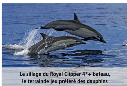
Le sillage du Royal Clipper 4*+ bateau, le terrain de jeu préféré des dauphins