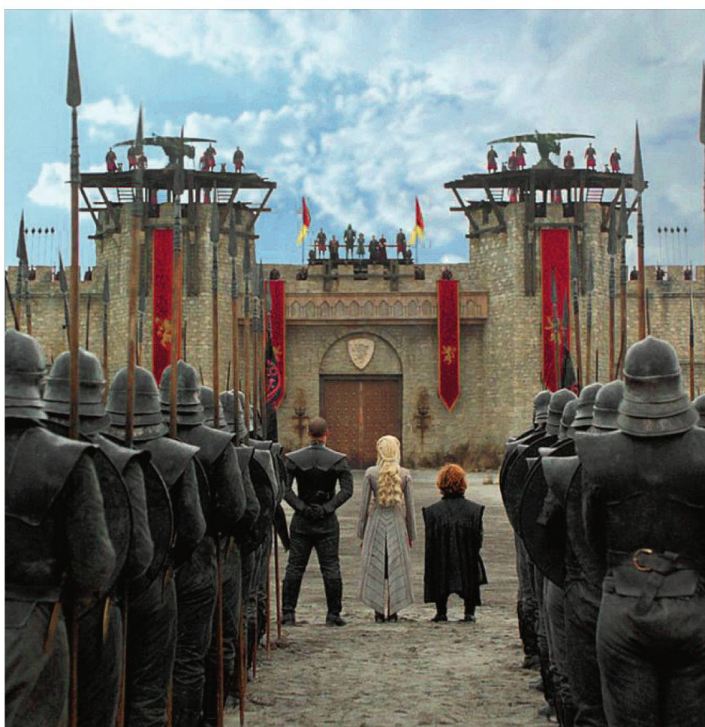
La série Game of Thrones a engendré un nouveau tourisme.