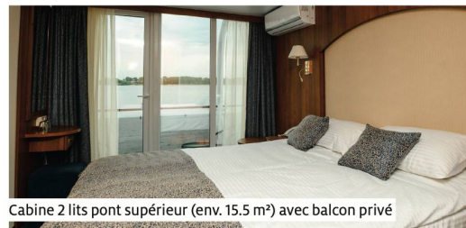
Cabine 2 lits pont supérieur (env. 15.5 m 2 ) avec balcon privé