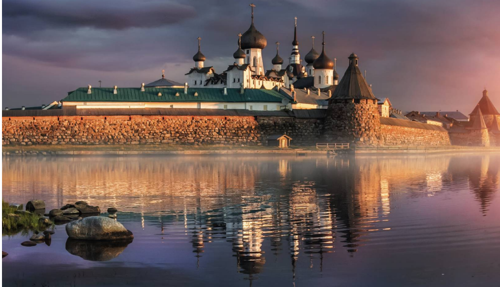
MS Thurgau Karelia****