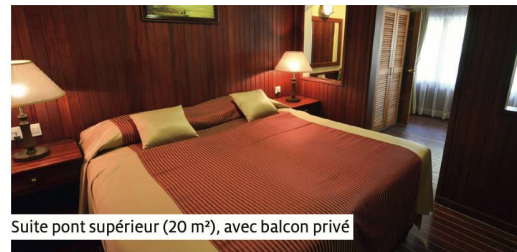
Suite pont supérieur (20 m²), avec balcon privé