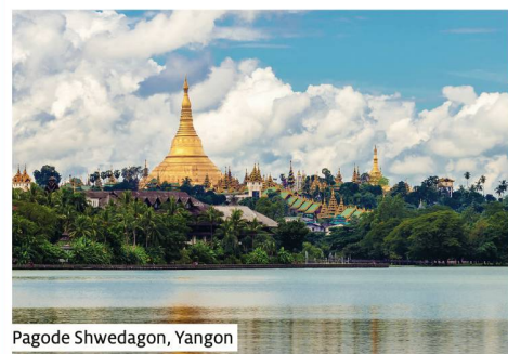
Pagode Shwedagon, Yangon

Toutes les excursions incluses | Sous réserve de modifications du programme