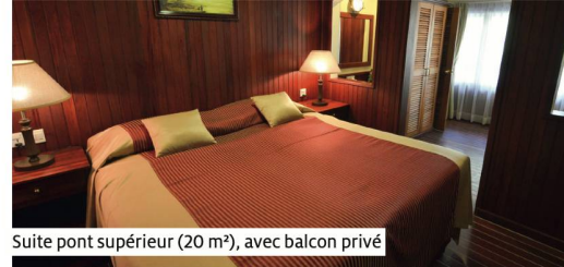
Suite pont supérieur (20 m²), avec balcon privé

Le RV Thurgau Exotic 1 a été construit en 2009 en Birmanie sous la régie et l'expertise de l'armateur fluvial Suisse Thurgau Travel. Son intérieur est richement décoré en bois précieux et rappelle le passé colonial de la Birmanie. Le petit nombre de passagers (20) garantit une atmosphère détendue et intime. Les cabines individuelles de 12 m² et toutes les suites sont aménagées de douches/WC, coffre-fort et régulateur de climatisation. Les suites de 20 m² sur le pont principal disposent de portes coulissantes qui s'ouvrent sur la promenade extérieure. Les suites (20 m²) du pont supérieur et la front suite (24 m²) disposent d'un balcon privé. Le restaurant offre un choix varié de plats, de la cuisine internationale aux mets asiatiques les plus fins. Un bar panoramique couvert se trouve sur le pont soleil et invite à déguster de bons cocktails et à passer des soirées en bonne compagnie. Bateau non-fumeur (autorisation de fumer sur le pont soleil).