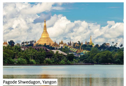
Pagode Shwedagon, Yangon

Toutes les excursions incluses | Sous réserve de modifications du programme