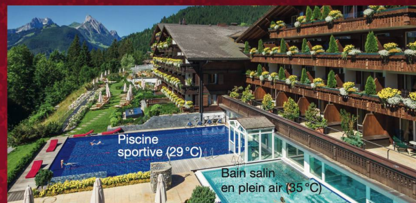
Piscine sportive (29 °C)