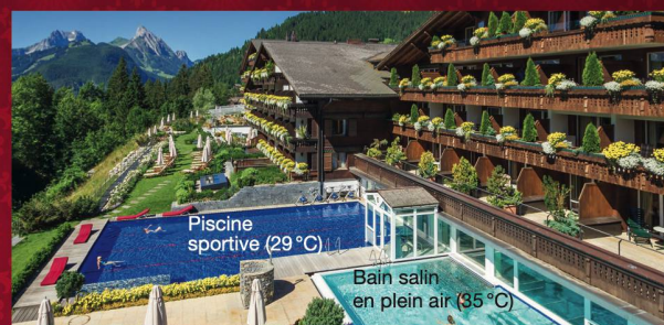
Piscine sportive (29 °C)