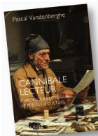
Cannibale Lecteur, chroniques littéraires et perles de culture, Editions Favre

érudition, et ce supplément d'âme que seul un éditeur peut apporter quand il parle des pages lues et imprimées. Une belle surprise.