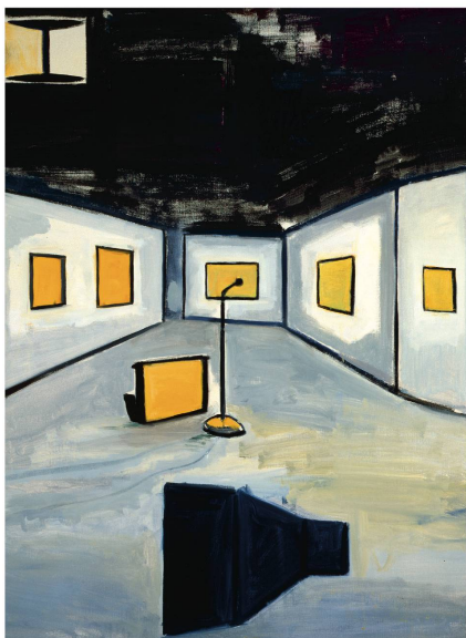
René Daniëls, Mamco (Musée d'art moderne et contemporain) à Genève, jusqu'au 5 mai

Voici une rétrospective d'un des artistes majeurs de la fin du XX e siècle, on a nommé René Daniëls. Sa carrière fut fulgurante, notamment en raison d'un AVC qui a interrompu son ascension en 1987, alors qu'il n'avait que 37 ans. Il n'a repris son travail qu'en 2006. En attendant, on ne peut qu'admirer des œuvres à la fois marquées par une irrévérence punk et le lien avec la grande poésie, ses tableaux fourmillant d'allusions à Beaudelaire et à Apollinaire, entre autres.