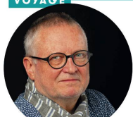
Jean-Pierre Grandjean, photographe