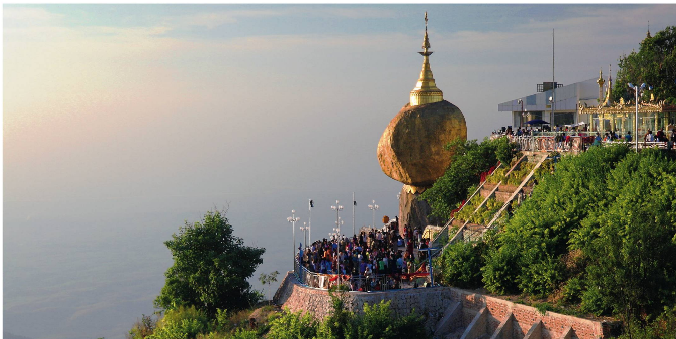
La fameuse «Pagode de Kyaiktiyo», située dans le sud-est du pays. Un coup de cœur pour tous les visiteurs.