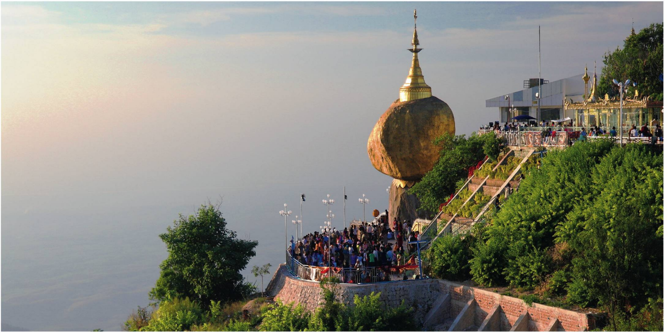
La fameuse «Pagode de Kyaiktiyo», située dans le sud-est du pays. Un coup de cœur pour tous les visiteurs.