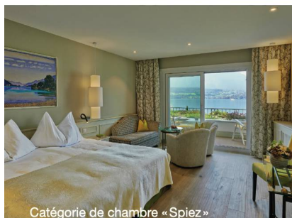
Catégorie de chambre «Spiez»

homme ou une femme. Est-ce qu'un corps masculin hyperbodybuildé attire davantage l'attention d'une femme que le regard d'un homme, sa façon d'être, son empathie et sa lumière intérieure? Yann Moix a-t-il si peur de son vieillissement qu'il a besoin de se prouver qu'il peut encore séduire en s'affichant au bras d'une femme bien plus jeune que lui? A-t-il besoin de cette valorisation qui peut d'ailleurs être fort trompeuse? Quand on voit une femme jeune au bras d'un homme mûr, on se dit: «Mais qu'est-ce qu'elle lui trouve?» Et on se met à suspecter que c'est parce qu'il a de l'argent et une situation enviable. Hypothèse insultante, bien entendu. Le commentaire de Yann Moix me fait mieux comprendre pourquoi tant de femmes sont soucieuses de rajeunir leur apparence à coup de Botox, de liftings et de lèvres artificiellement gonflées pour paraître plus pulpeuses. Elles oublient que l'expérience de la vie, la sagesse qu'elles en ont tiré, le pétilllement, voire l'espièglerie d'un regard peuvent plus que tout attirer l'attention d'un homme, et pourquoi pas le séduire.