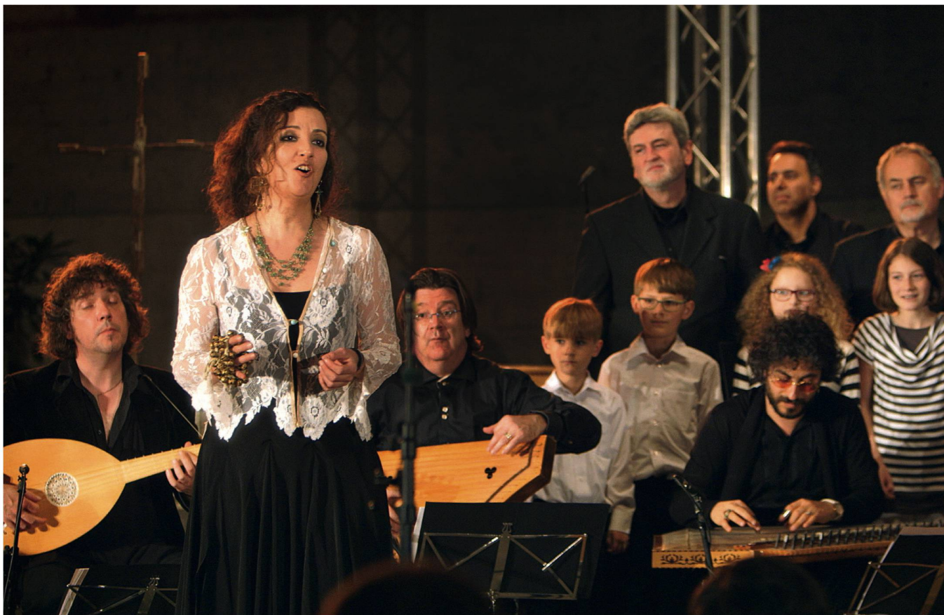
Ce film raconte, entre autres, la préparation de ce concert avec des musiciens venus de plusieurs pays.