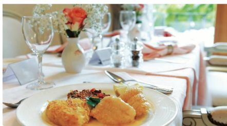
Une table et un service hôtelier de premier ordre.