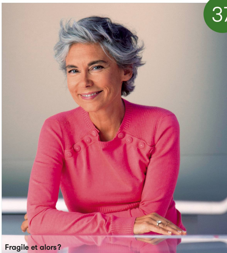
Fragile et alors?