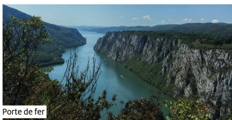
Porte de fer