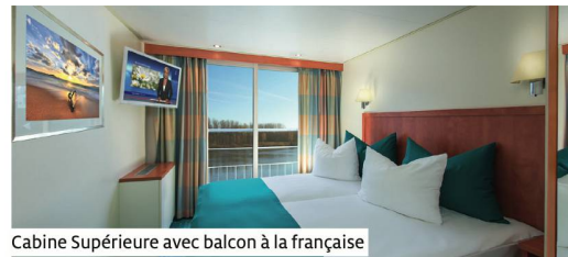
Cabine Supérieure avec balcon à la française