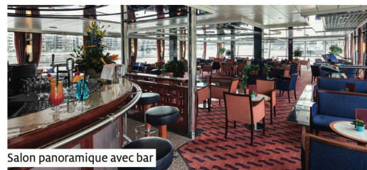
Salon panoramique avec bar