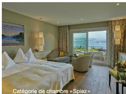
Catégorie de chambre «Spiez»