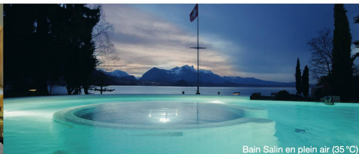
Bain Salin en plein air (35 °C)