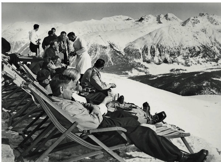
Engadine Une pause bien méritée devant un paysage magnifique.