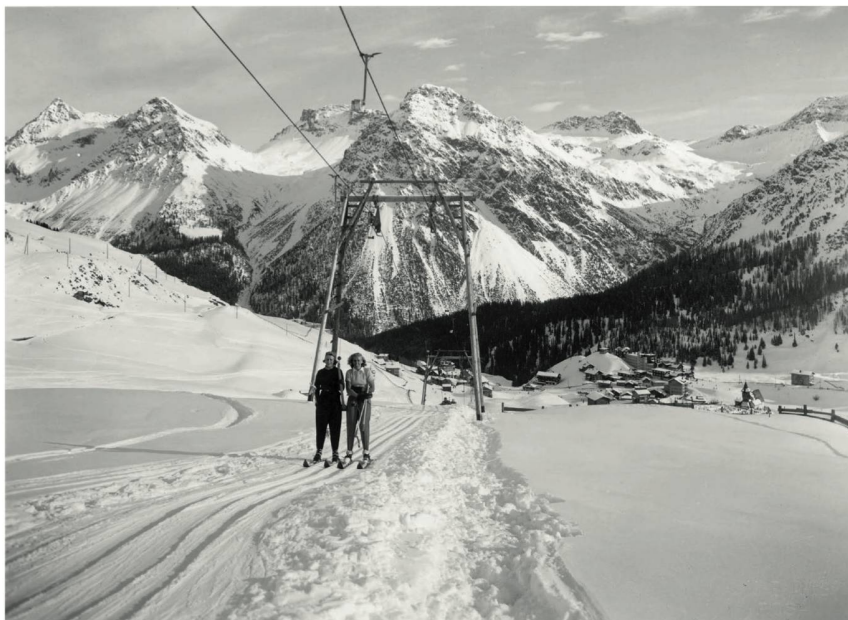
Arosa. Ces bonnes vieilles arbalètes, terreur de nombre de débutants.