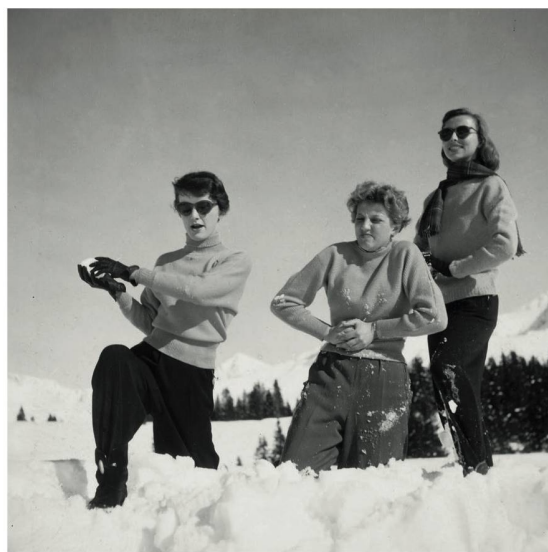
Détente Une bataille de boules de neige?