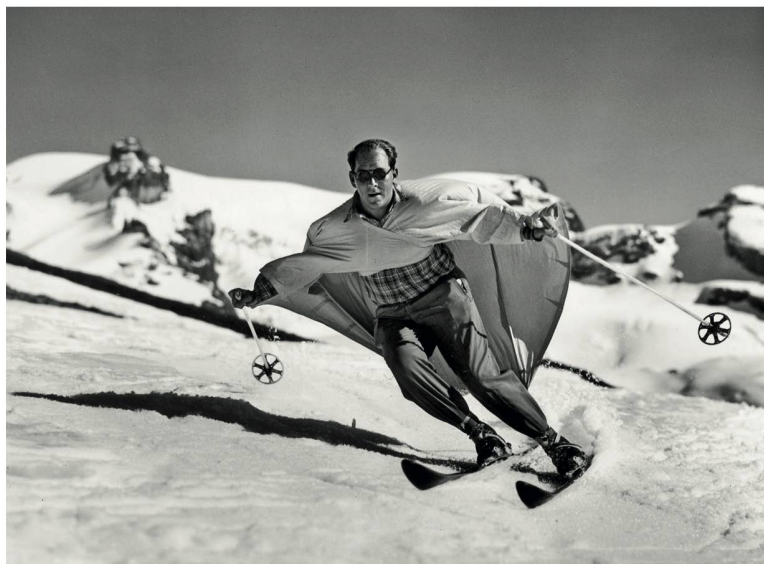
Engelberg Un drôle de skieur volant à pleine vitesse.