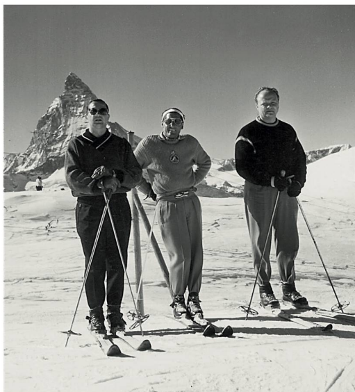
Zermatt On posait déjà devant le Cervin.