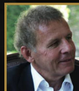
Patrick Poivre d'Arvor Invité exceptionnel

En partenariat avec Blüthner THE GOLDEN TONE