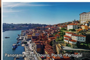
Panorama sur le Douro, Porto - Portugal