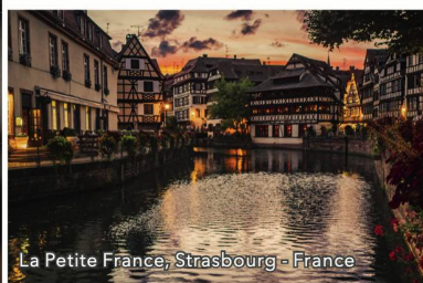
La Petite France, Strasbourg - France