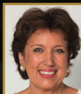
Roselyne Bachelot Invitée exceptionnelle