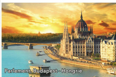
Parlement, Budapest - Hongrie