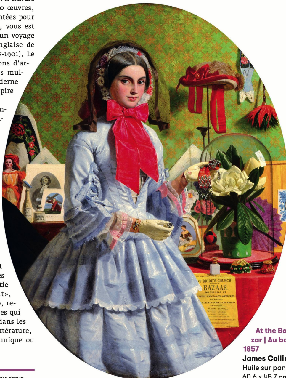
At the Bazar | Au bazar, 1857

La peinture anglaise de Turner à Whistler, du 1 er février au 2 juin 2019, à la Fondation de l'Hermitage, à Lausanne