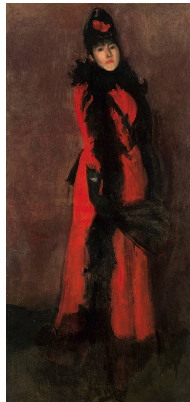
Red and Black : The Fan | Rouge et noir : l'éventail, 1891/1894