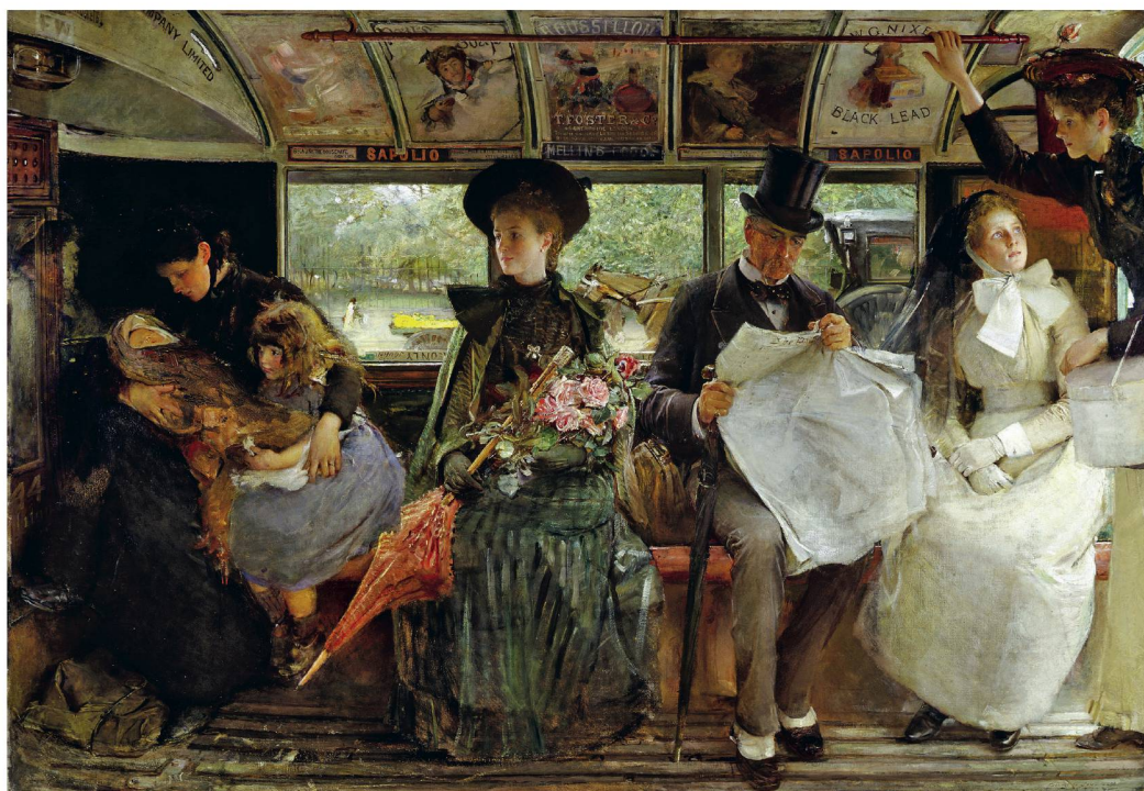
The Bayswater Omnibus | L'omnibus de Bayswater, 1895