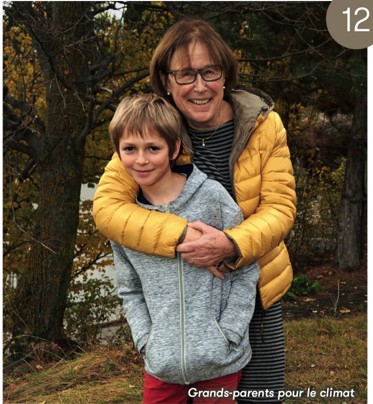
Grands-parents pour le climat