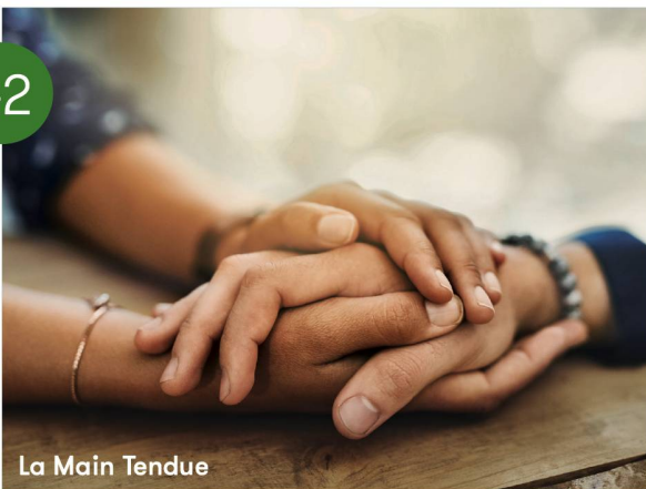
La Main Tendue