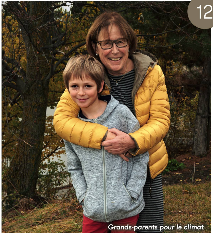
Grands-parents pour le climat