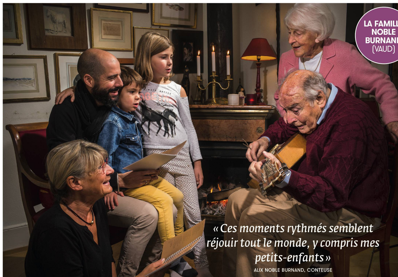
LA FAMILLE NOBLE BURNAND (VAUD)

Partez à la découverte des capitales de l'Estonie, de la Lettonie et de la Lituanie. Trois villes aux charmes certains !