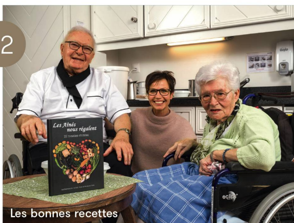
Les bonnes recettes