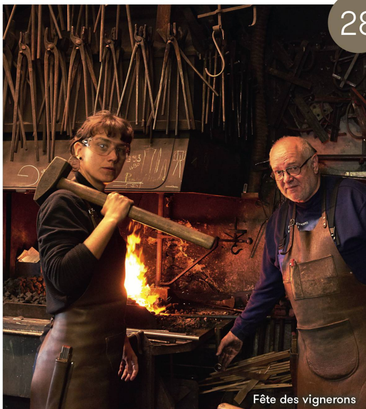
Fête des vignerons