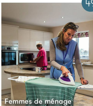
Femmes de ménage