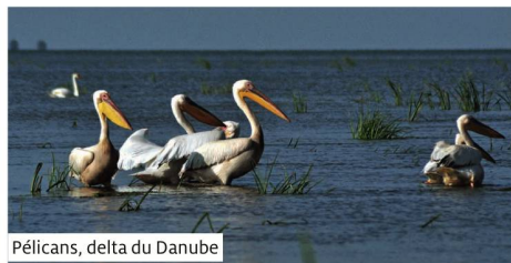
Pélicans, delta du Danube