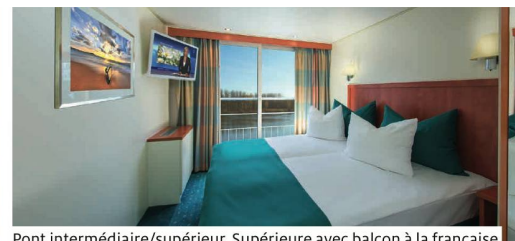
Pont intermédiaire/supérieur, Supérieure avec balcon à la française