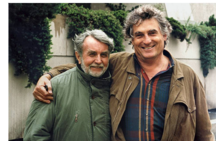
Été 1996.