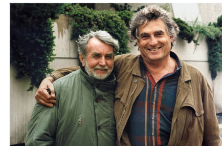
Été 1996.