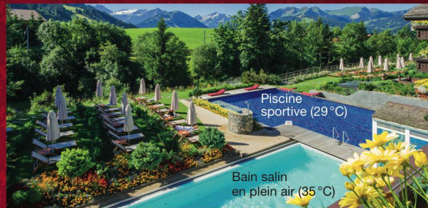
Bain salin en plein air (35 °C)