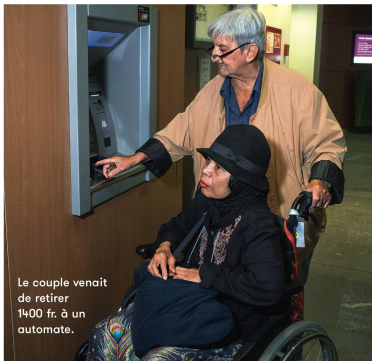
Le couple venait de retirer 1400 fr. à un automate.

son salon : Jacques Mayol, Jacques Cousteau, Brigitte Bardot. Avant de nous quitter, il évoque ses origines corses qui sont peut-être pour quelque chose dans son acharnement têtue à exiger réparation.