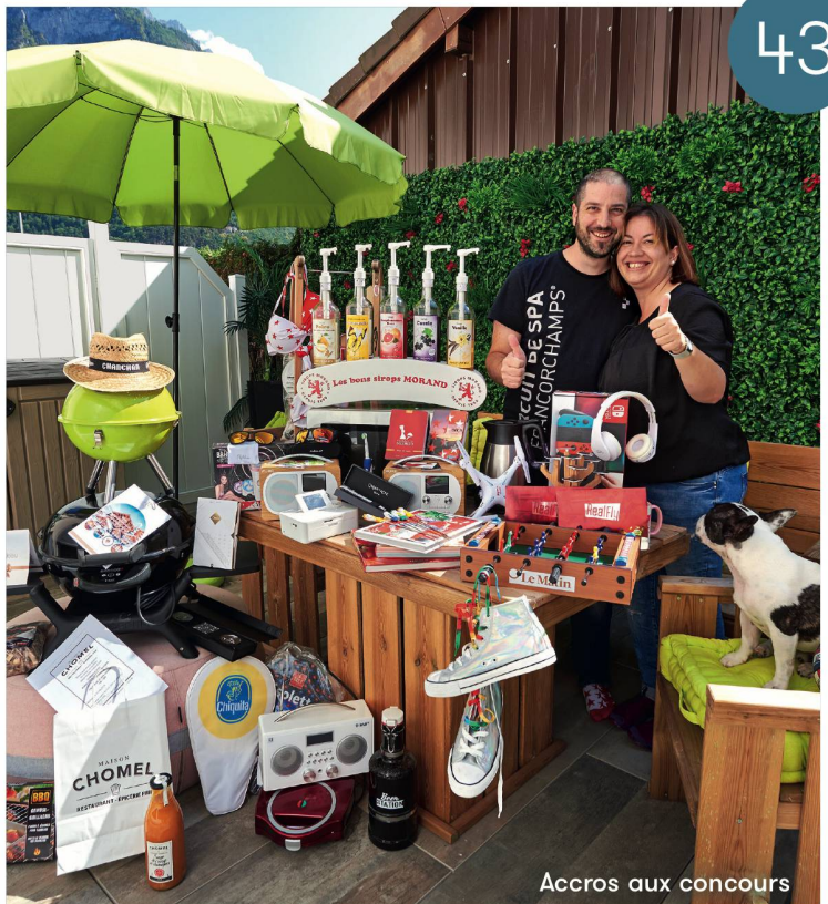
Accros aux concours