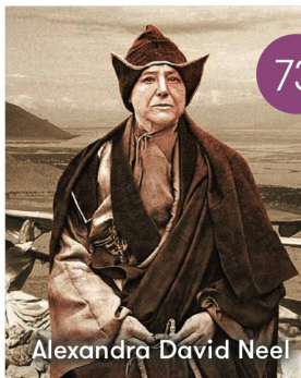
Alexandra David Neel