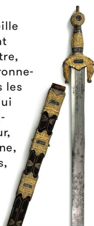
Une épée du Moyen Age, bel objet de collection.