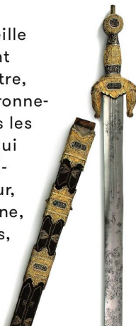
Une épée du Moyen Age, bel objet de collection.

Dans l'antre de Pierre Galitch, dans la vieille ville de Neuchâtel, les antiquités se suivent et ne se ressemblent pas : tableaux de maître, fauteuils Empire, statues de la Vierge, ferronnerie d'art, rouet d'antan, il y en a pour tous les goûts et toutes les bourses. Mais tout ce qui fit la fierté de nos aïeux et enfièvre les collectionneurs n'a pas forcément de la valeur, aujourd'hui. «Un fauteuil Louis XVI d'origine, que je vendais 5000 francs il y a vingt ans, part à 500 francs actuellement. Parfois même, les œuvres caritatives n'en veulent plus. Les mœurs ont changé, les gens se meublent chez Ikea et jettent leurs objets à chaque déménagement.» Il n'empêche, Pierre Galitch, 55 ans d'expérience dans le métier, trouve toujours