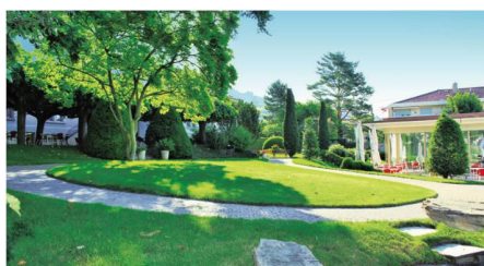
Les 3 bâtiments de l'établissement sont idéalement implantés au cœur d'un parc arborisé de 10'000 m 2 .

Un espace Snoezelen, un salon de coiffure, une salle de gymnastique et de rééducation sont à disposition de nos hôtes. Ces espaces permettent d'offrir un lieu de divertissement et relaxant tout en respectant leurs envies.