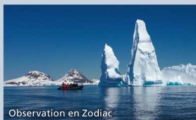
Observation en Zodiac

Vous arriverez à Genève dans la journée.