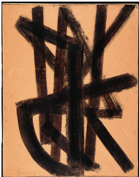
Brou de noix sur papier 65 x 50 cm, 1948