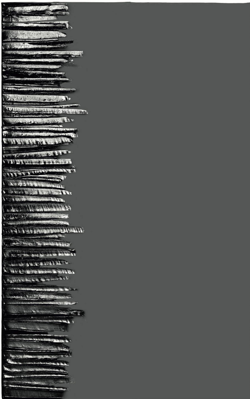
Peinture 202 x 125 cm, 19 juin 2017 Acrylique sur toile