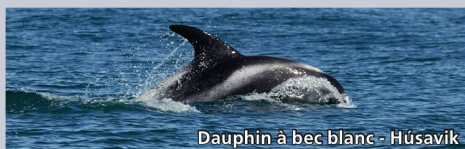
Dauphin à bec blanc - Húsavík

Entourée de plaines verdoyantes et de hauts sommets, la ville abrite un jardin botanique rassemblant des milliers d'espèces de plantes, de nombreux musées et des bâtiments remarquables dont l'église luthérienne Akureyrarkirkja. En option : tour en bus vers le lac Myvatn.