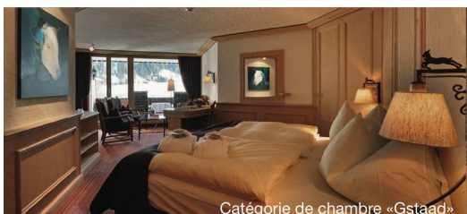
Catégorie de chambre «Gstaad»