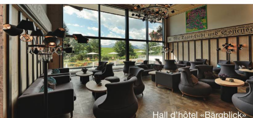
Hall d'hôtel «Bärgblick»