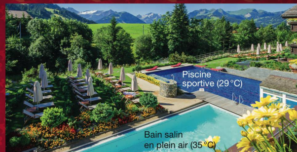
Piscine sportive (29°C)