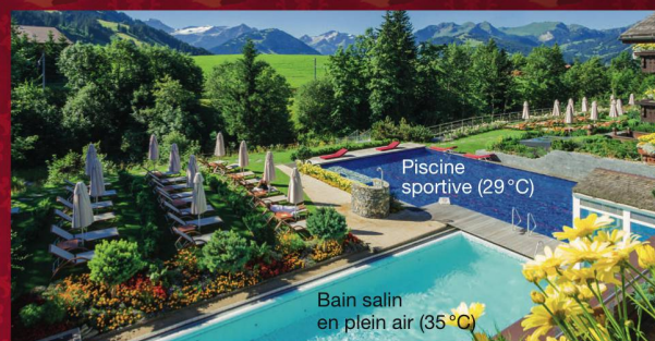
Piscine sportive (29 °C)