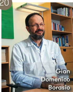
Gian Domenico Borasio