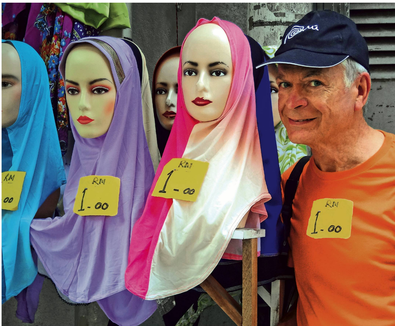
Le jeune homme de 72 ans fait en moyenne trois voyages par mois. Ici, en Indonésie.

d'une petite mort, même s'il précise qu'il comprend que, pour d'autres, ce ne soit absolument pas le cas. Les mots «vacances oisives» lui font à peu près un effet identique, lui qui, au bout d'une demi-journée de farniente sur une plage, commence à se demander pourquoi il existe.