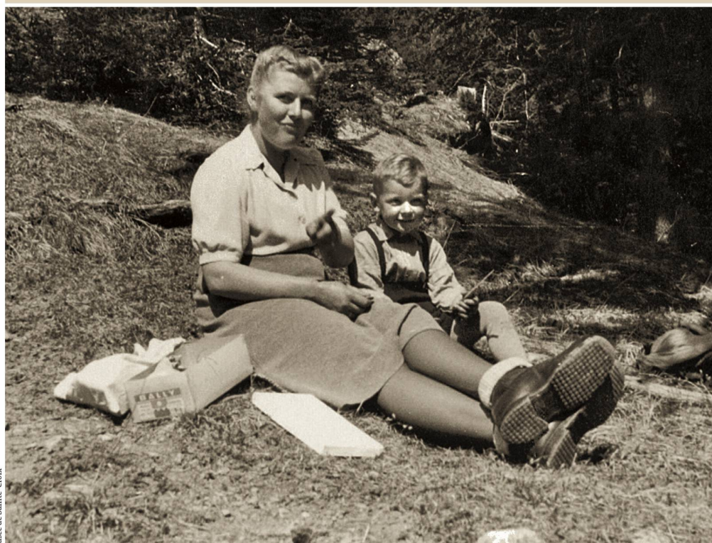
Mus e de Sainte-Croix