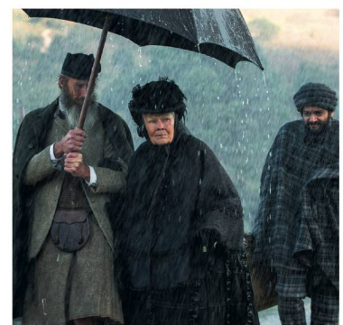
Frank Ockenfels, Focus Features, RTS/Jay LOUVION, Enrique Pardo et DR

Confident Royal , dès le 4 octobre sur les écrans romands.