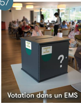
Votation dans un EMS