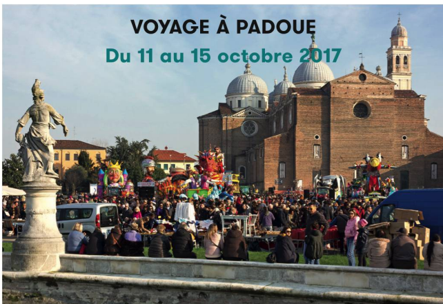
VOYAGE À PADOUE Du 11 au 15 octobre 2017