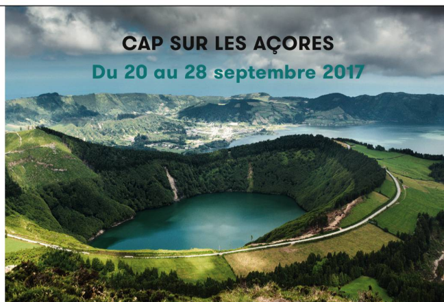
CAP SUR LES AÇORES Du 20 au 28 septembre 2017