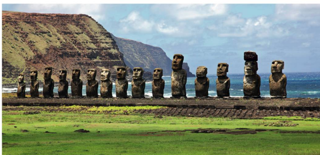
DESTINATIONS PHARES DU CHILI Du 15 au 29 octobre 2017