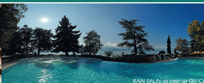
BAIN SALIN de plein air (35 °C)