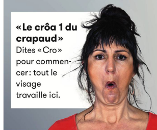
«Le crôa 1 du crapaud» Dites «Cro» pour commencer: tout le visage travaille ici.