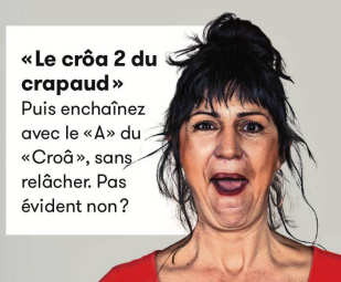
«Le crôa 2 du crapaud» Puis enchaînez avec le «A» du «Croâ», sans relâcher. Pas évident non?

sourciliers. A l'inverse, la partie basse du visage, celle qui tombe le plus facilement avec l'âge, est la plus facile à remodeler. «En un mois déjà, des résultats sont visibles», assure Hélène Arnold. Dire entre quinze et vingt fois «hein» permet de tonifier le cou et le décolleté. Ou «blé brûlé» pour muscler la bouche en pinçant les lettres, histoire d'activer l'oxygène et la microcirculation. Essayez aussi de faire le crapaud (voir photo). Ou encore