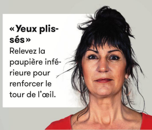
«Yeux plissés» Relevez la paupière inférieure pour renforcer le tour de l'œil.