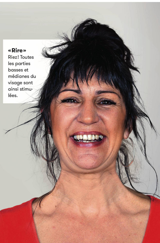
«Rire» Riez! Toutes les parties basses et médianes du visage sont ainsi stimulées.

le rire de la sorcière pour donner de la tension à toute la partie médiane du visage. Pour travailler l'orbiculaire des paupières et l'ouverture de l'œil, on peut aussi faire des exercices en prononçant simplement un «Oh!» (voir photo). Puis, pour plus d'intensité, en ajoutant «Oh, le bel homme!» ou «Oh, la vie est belle!» On le voit à travers ces exemples, la «face dance» n'a pas que pour mission de travailler les rides. Il y a aussi une pensée posi-