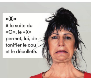
«X» A la suite du «O», le «X» permet, lui, de tonifier le cou et le décolleté.