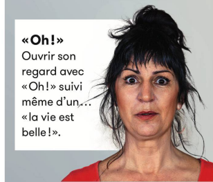
«Oh!» Ouvrir son regard avec «Oh!» suivi même d'un... «la vie est belle!».