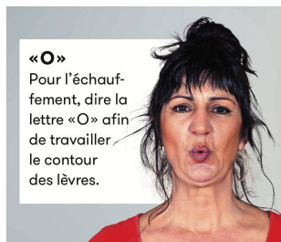
«O» Pour l'échauffement, dire la lettre «O» afin de travailler le contour des lèvres.

Véritable fitness du visage, attendez-vous tout de même à faire quelques efforts. «C'est une contraction musculaire. Il faut dire le mot entre dix et vingt fois. Les gens sont très surpris d'avoir des courbatures!» Le front arrive en première place des parties du visage les plus difficiles à travailler, car la peau y est plus fine. Ici, comme exercice, vous pouvez, par exemple, simplement faire bouger les muscles