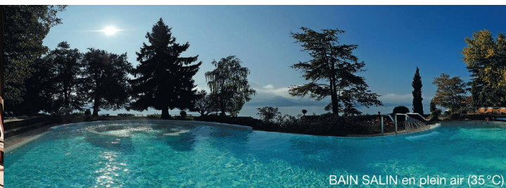
BAIN SALIN en plein air (35°C)