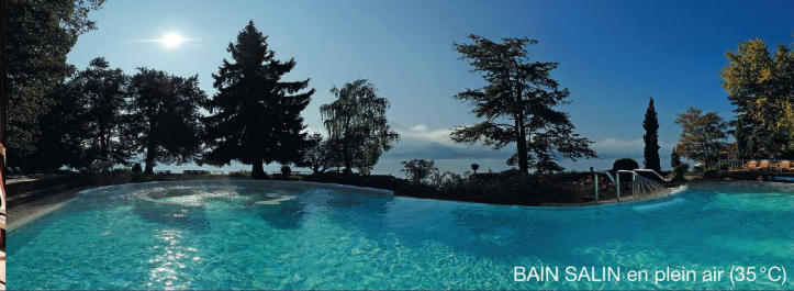
BAIN SALIN en plein air (35°C)