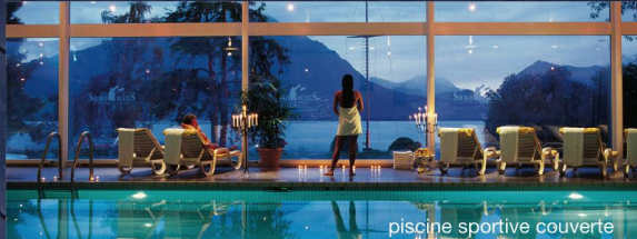
piscine sportive couverte