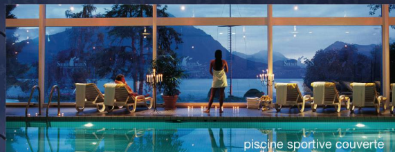
piscine sportive couverte