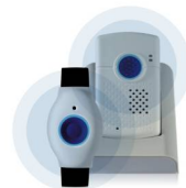
SmartLife Care Mini le compagnon discret avec module GPS