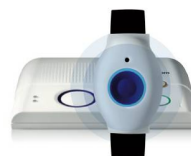
SmartLife Care Genius le parfait colocataire pour une sécurité sur mesure