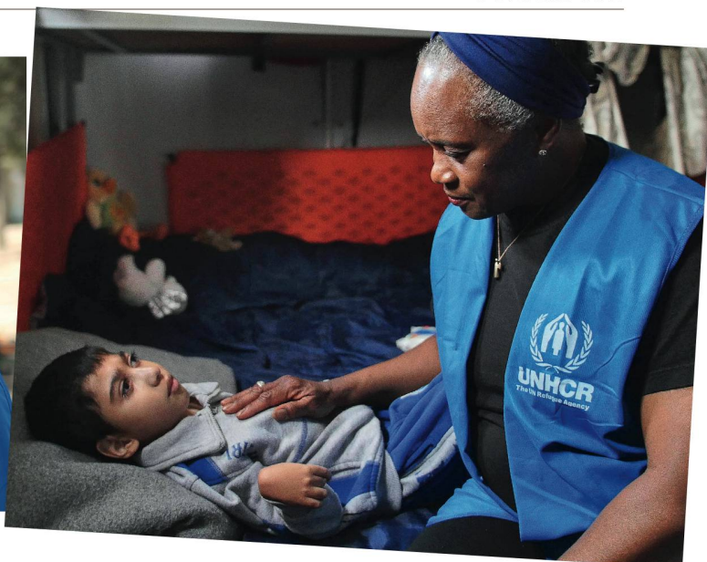
Barbara Hendricks lors de son dernier voyage en Grèce, auprès des réfugiés syriens.

et proclame le plus de haine, purement pour les raisons financières.