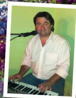
Animation par ROCCO musicien et chanteur