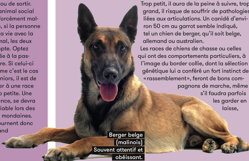
Berger belge (malinois) Souvent attentif et obéissant.

Les races de chiens de chasse ou celles qui ont des comportements particuliers, à l'image du border collie, dont la sélection génétique lui a conféré un fort instinct de «rassemblement», feront de bons compagnons de marche, même s'il faudra parfois les garder en laisse,