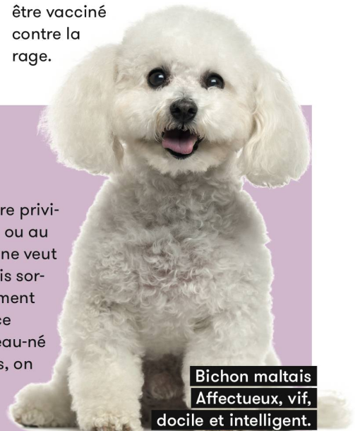
Bichon maltais Affectueux, vif, docile et intelligent.

Au camping aussi, les petits formats (cavalier king charles, yorkshire, chihuahua, épagneul tibétain ou shih tzu) devraient avoir la cote. Un petit chien trouvera plus facilement sa place et en laissera davantage à ses propriétaires ! A noter que, si vous passez la frontière avec votre chien, il doit être vacciné contre la rage.