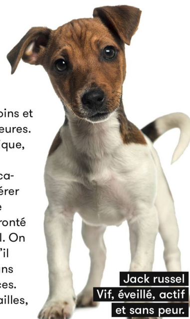
Jack russel Vif, éveillé, actif et sans peur.

Aucune race de chien n'apprécie de rester seule. Pourtant, la réalité des maîtres encore actifs professionnellement ne leur permet pas d'être toujours au côté de leur compagnon. Dès lors, l'important est que le chien puisse sortir régulièrement pour faire ses besoins et se dégourdir, notamment entre midi et deux heures. Le cas des chiots est d'autant plus problématique, car il faudrait pouvoir consacrer une à deux semaines à plein temps afin de faire leur éducation. Prendre congé à ce moment-là peut s'avérer utile, mais les activités et le rythme devront se rapprocher de ceux auquel le chien sera confronté une fois que son maître aura repris son travail. On le laissera ainsi progressivement seul pour qu'il s'habitue aux absences. Notre citadin de 50 ans aura le choix entre une bonne centaine de races. Parmi les individus de petite et de moyenne tailles, on trouve le yorkshire ou le fox terrier.