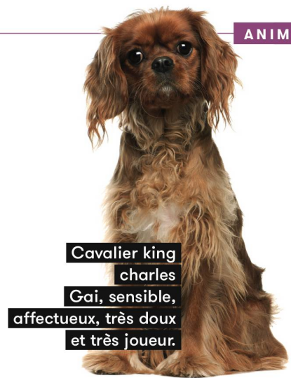
Cavalier king charles Gai, sensible, affectueux, très doux et très joueur.