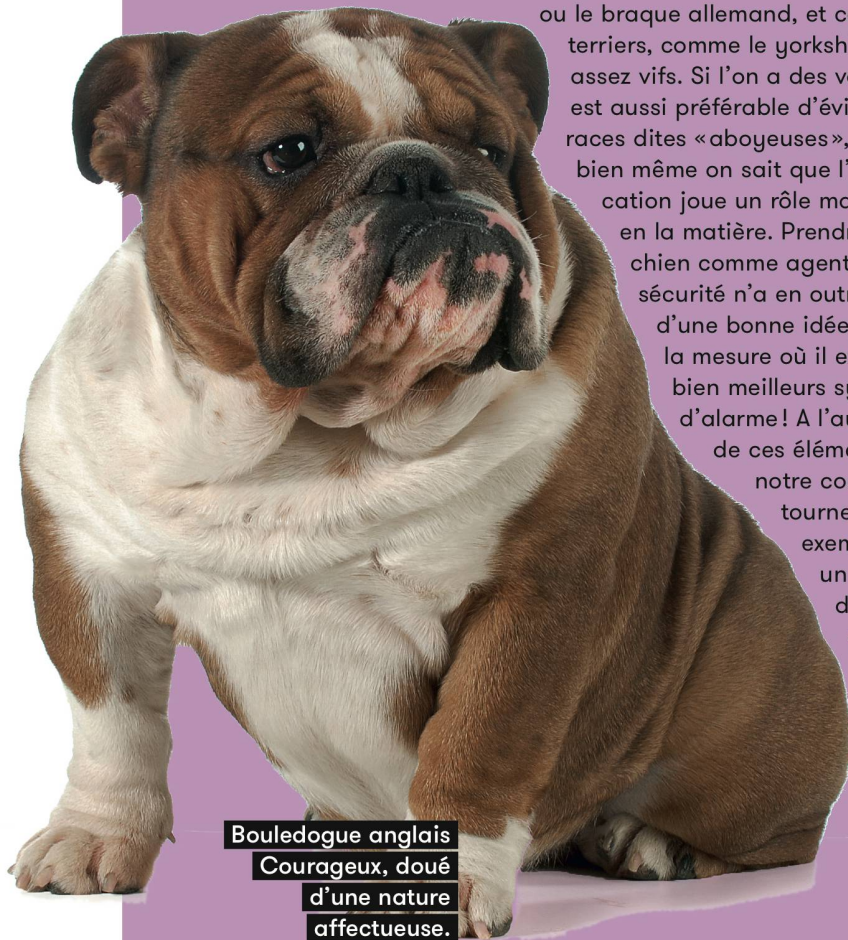
Bouledogue anglais Courageux, doué d'une nature affectueuse.

notre couple se tournera, par exemple, vers un bouledogue — anglais ou français — ou un cavalier king charles.