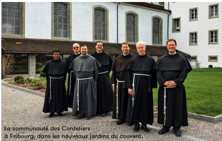
La communauté des Cordeliers à Fribourg, dans les nouveaux jardins du couvent.