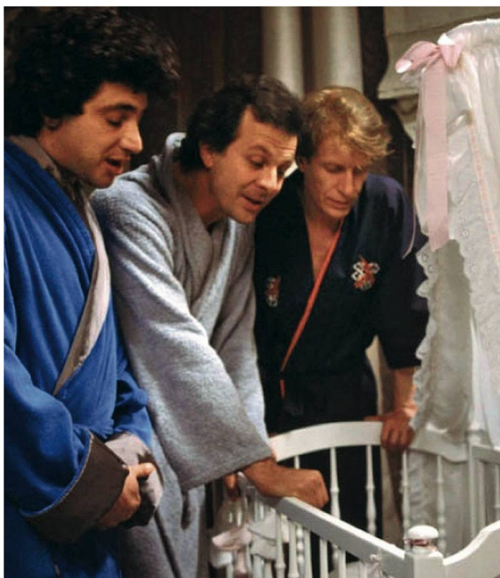
De gauche à droite, Michel Boujenah, Roland Giraud et André Dussollier dans Trois hommes et un couffin .