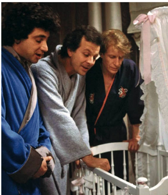
De gauche à droite, Michel Boujenah, Roland Giraud et André Dussollier dans Trois hommes et un couffin .